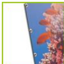
Doek + ringen om de 30 cm