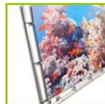
Doek + ringen + alu frame + haken = COMPLEET